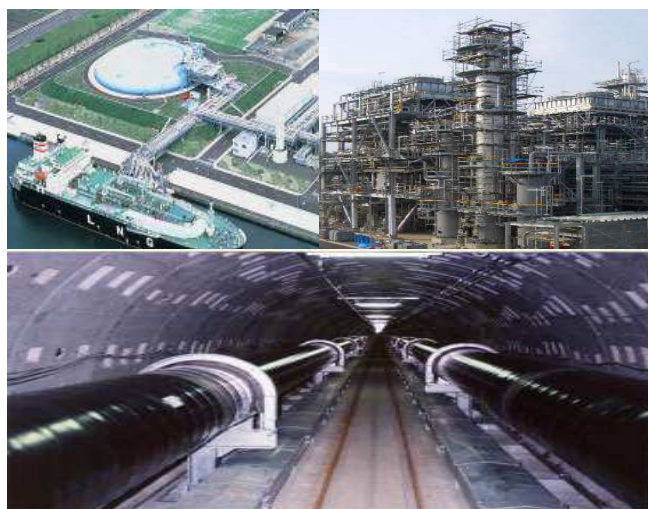
適用が想定される各種プラントエリア